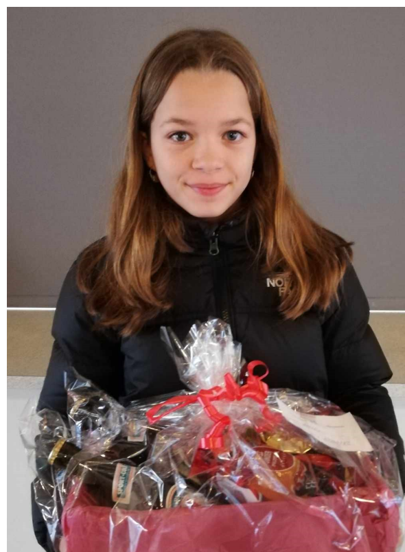
Den glade og heldige vinder